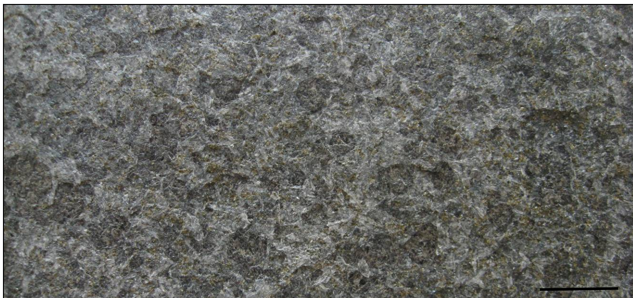
Fig. 6.2: Eksempel på en jetbrændt overflade af en gabbro. Skala = 10 mm.

Sandblæsning udføres med aluminiumoxid eller andre hårde materialer, som med trykluft blæses mod stenen. Metoden anvendes til inskription på sten og til ornamenter. Sandblæsning anvendes desuden til afrensning af sten samt til fjernelse af tidligere bearbejdnings. Sandblæsningen resulterer i knusning af de eksponerede mineraler i stenoverfladen, hvorved stens glans nedsættes. Sandblæste sten er på grund af den knuste struktur generelt modtagelige for begroning. Sandsten er bedst egnet til sandblæsning.