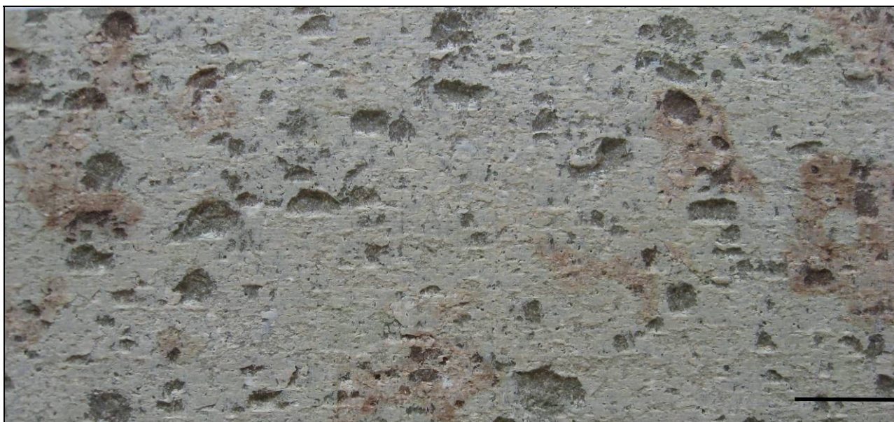
Fig. 6.3: Eksempel på strukturen af en høvlet kalkstensoverflade. Skala = 10 mm.

lingen af overfladen resulterer i dannelse af relativt store udvindinger/fordybninger, der giver stenen et spættet udseende (Fig. 6.3).